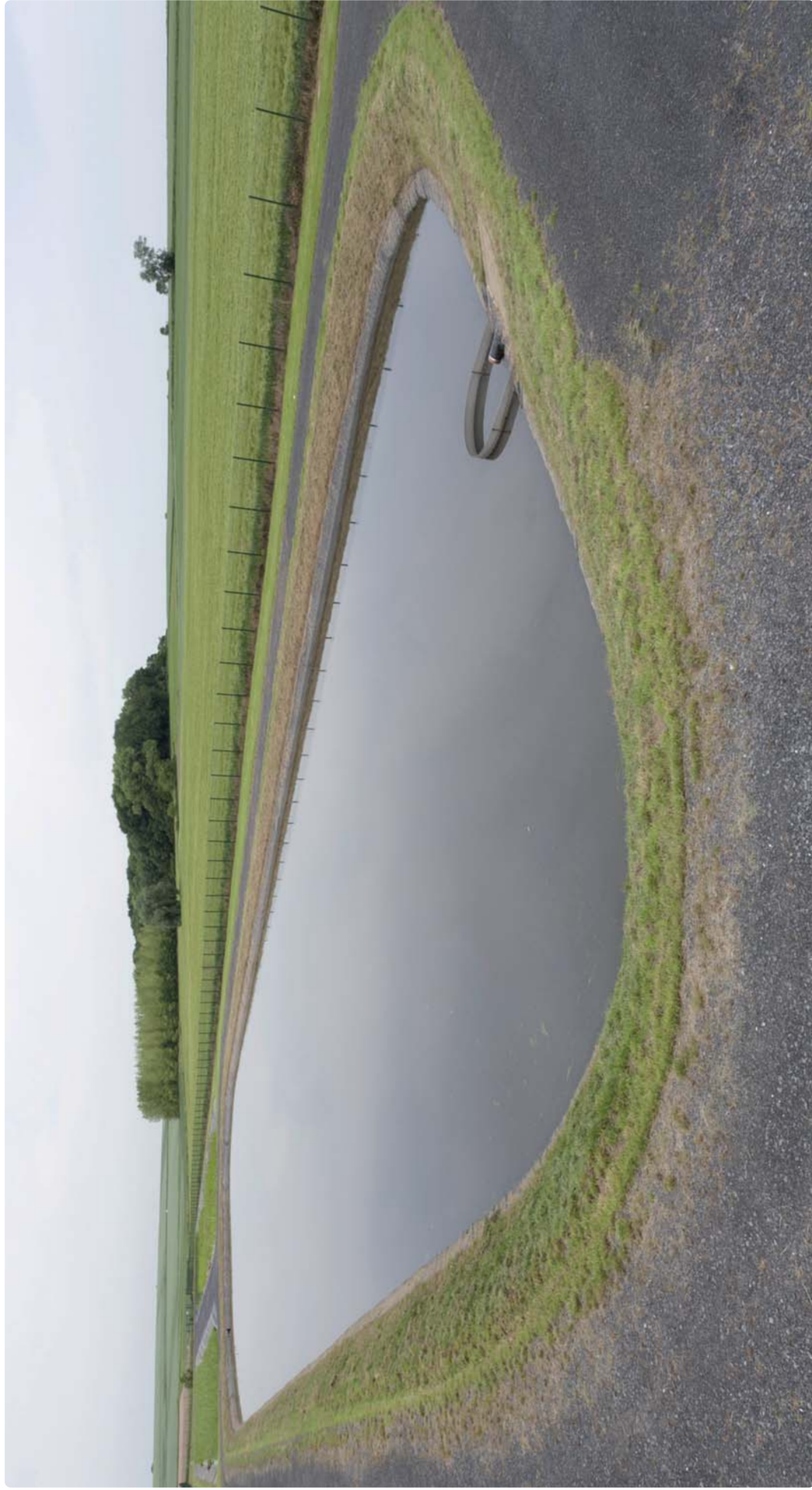
STATION D'ÉPURATION PAR LAGUNAGE NATUREL DE RÉCOURT - 350 EQ/H