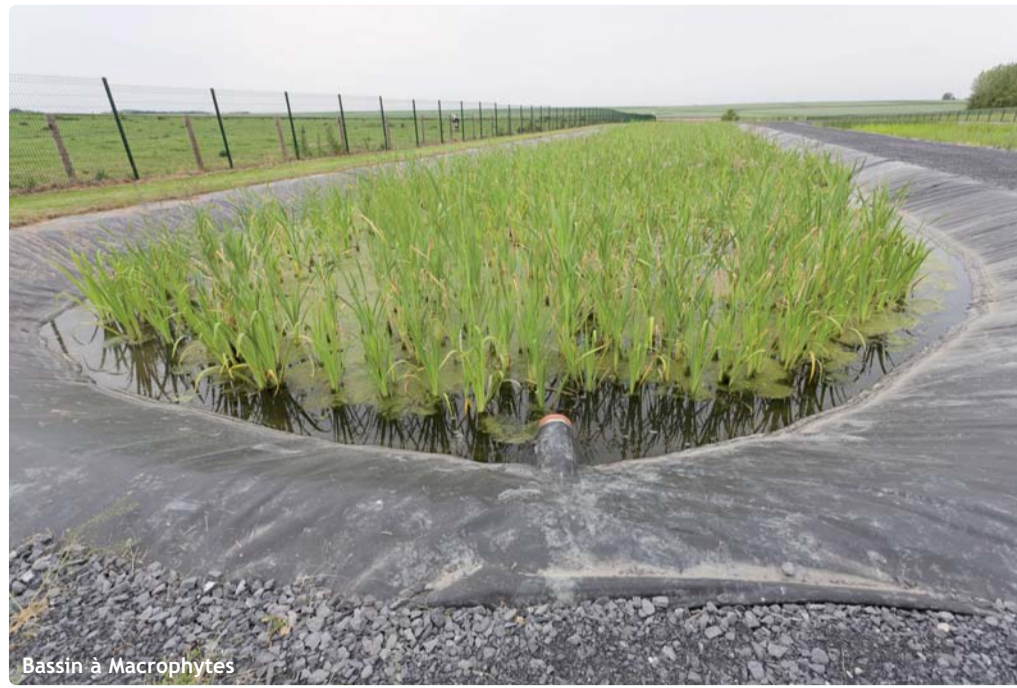
Bassin à Macrophytes