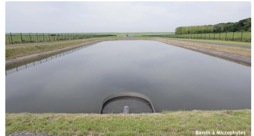
Bassin à Microphytes