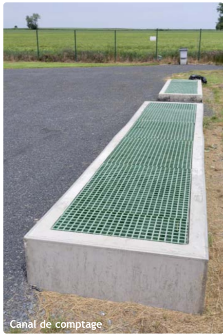
Canal de comptage