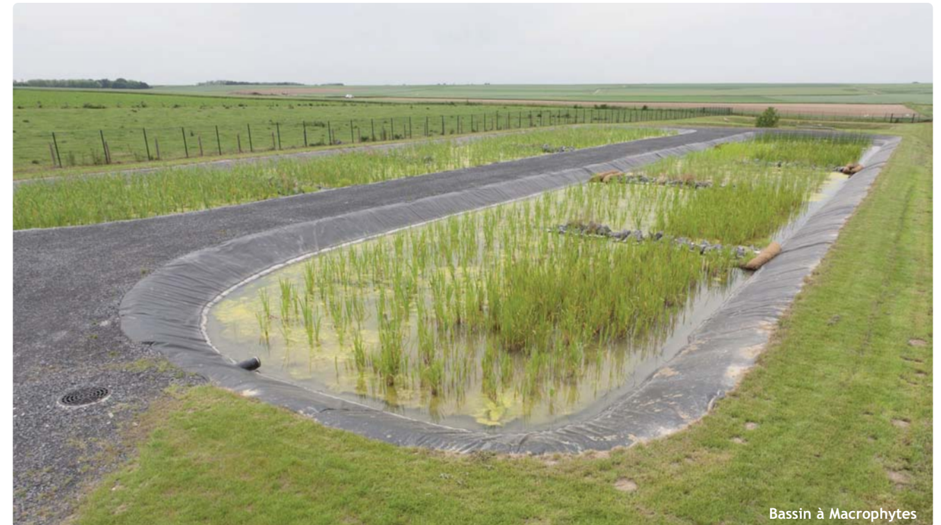
Bassin à Macrophytes