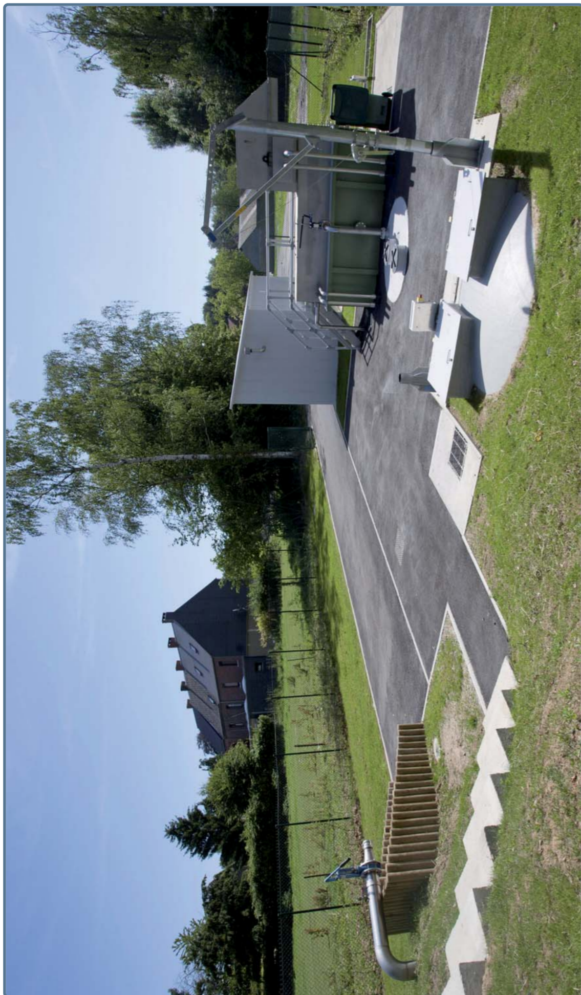
STATION D'ÉPURATION DU HAMEAU DES LANIÈRES (LA LONGUEVILLE)