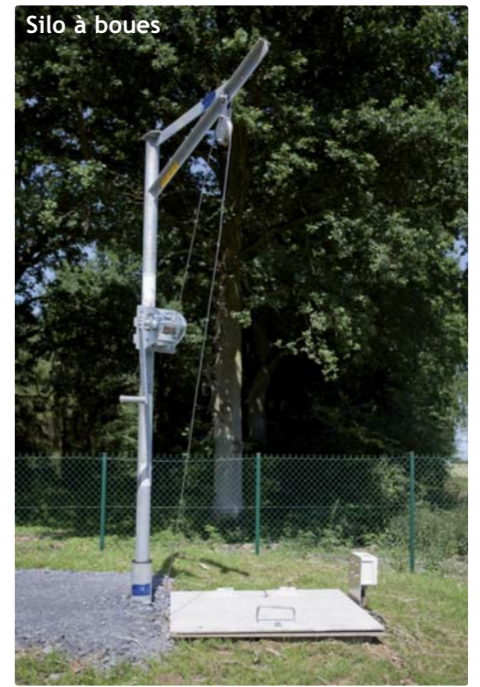
Silo à boues