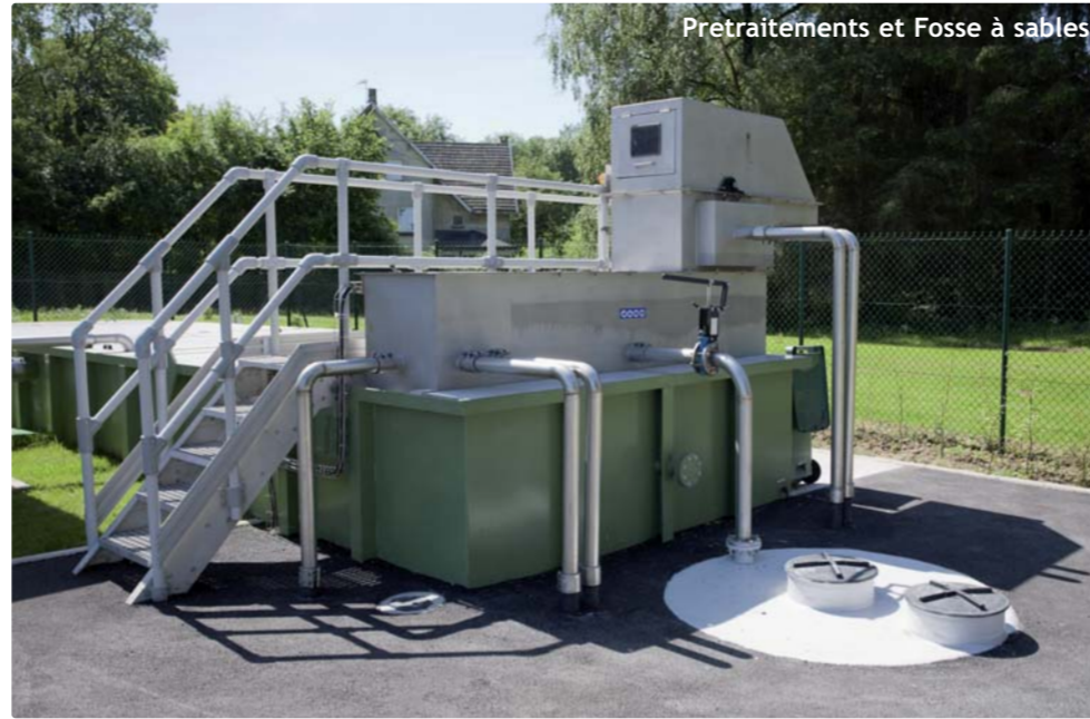
Pretraitements et Fosse à sables