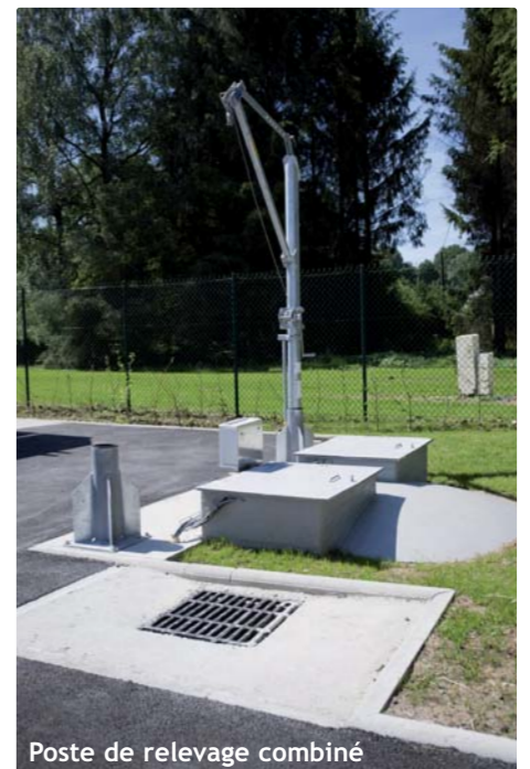
Poste de relevage combiné