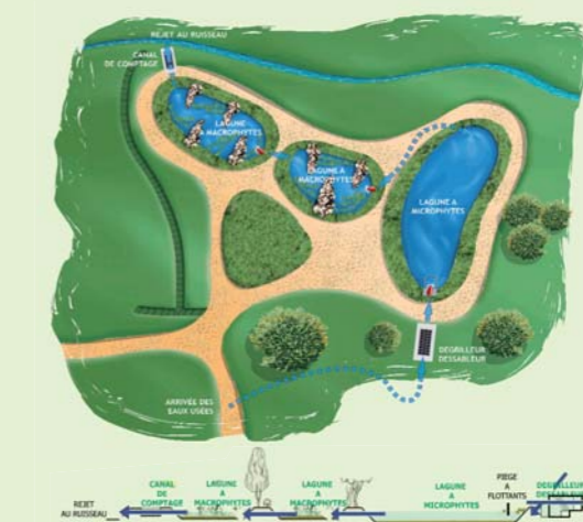
Station d'épuration par lagunage naturel